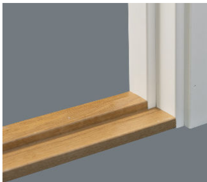
Tröskel av hårdträ.