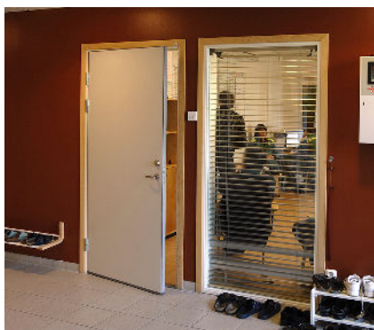
Ljuddörr 40dB används oftast i sammanträdesrum