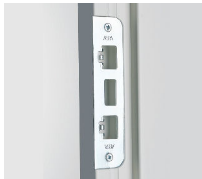
Slutbleck för Assa 310 låshus.