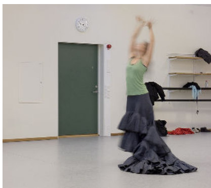
Ljuddörr i Danshögskolans lokaler