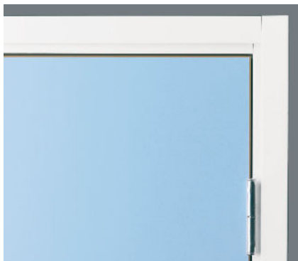
Skyddande kant runt om hela dörrbladet som både skyddar och gör det lätt att hålla rent.